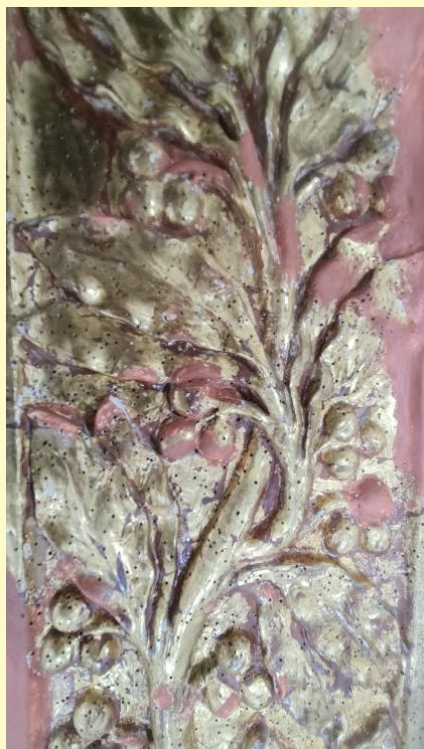
Quelques détails du retable en cours de restauration. On voit les petits trous que creusent les xylophages !